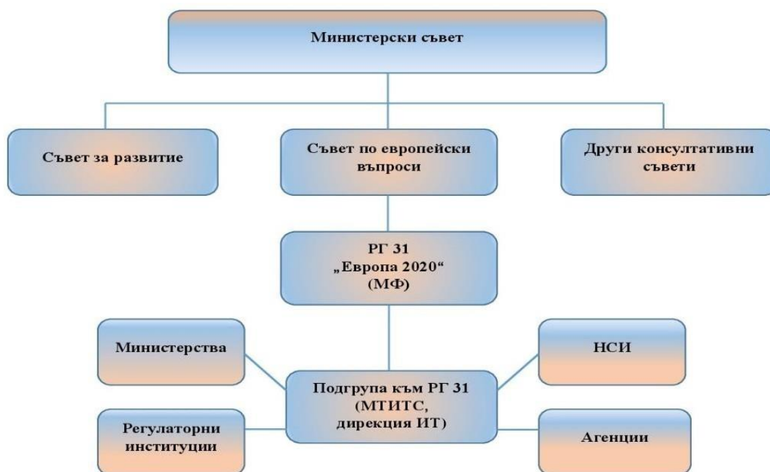
Фигура 3: Органиграма

Механизмът за управление, координация и контрол на програмата е част от националния координационен механизъм по въпросите на ЕС.