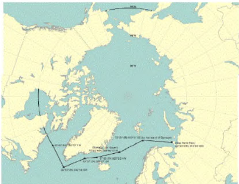
Фигура 2 – Максимална степен на приложение на арктически води