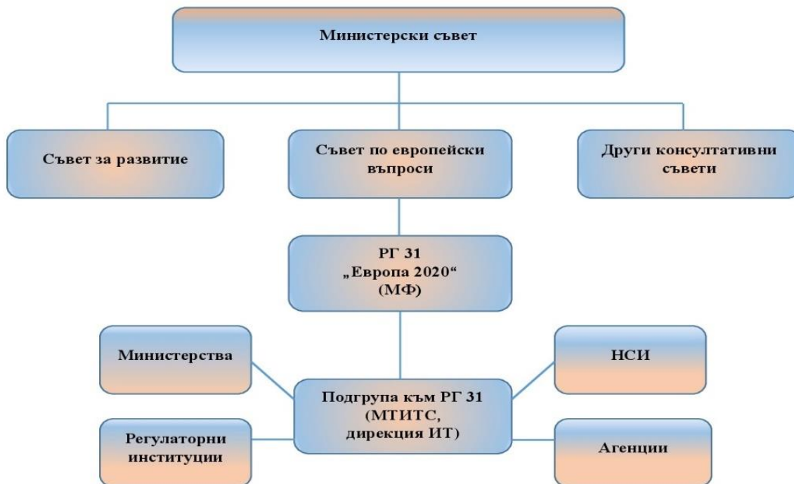
Фигура 3: Органиграма

Изпълнението на Национална Програма „Цифрова България 2025“ е ангажимент на всички ангажирани държавни структури и трябва да бъде осъществявано по ефективен и ефикасен начин, като се наблюдава постигането на съответните индикатори за изпълнение, както и резултатите от тях.